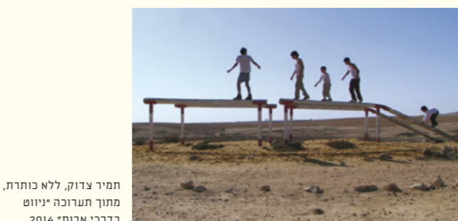
תמיר צדוק, ללא כותרת, מתוך תערוכה יזוונט בדרכי אבות' 2014