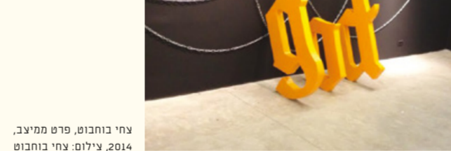
צחי בחבוט, פרט מייב, 2014

רח' אבן גבירול 106-108 בימים ה' 19:00-23:00 ו' 10:00-17:00, שבת 10:00-17:00, 19:00-23:00 גבירול 0 / bavital@gmail.com / vexler@gmail.com