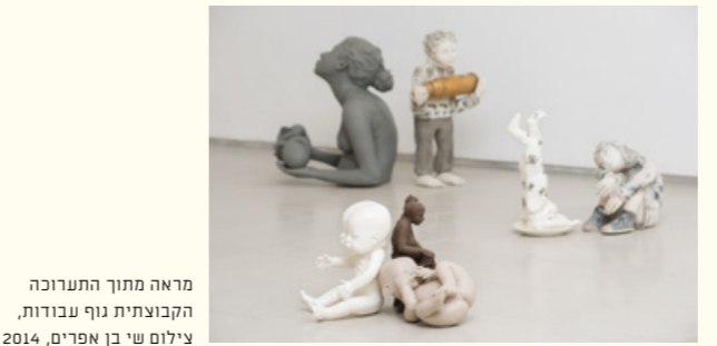
מראה מתוך התערוכה הקבוצתית נוף עבודות, צילום: שי בן אפרים, 2014

המרכז לאמנות עכשווית השוכן ליד, יהיה פתוח בימים ו'-שבת בשעות 10:00-14:00 תערוכה Hiding Wood in Trees אמנים משתתפים: וילפרדו פריאטו ואריאל שלוינגר אוצרת: חן תמיד